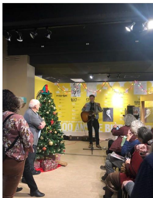
Cocktail de Noël

Auparavant composé de certains membres de la communauté muséologique, à leur demande, nous invitons maintenant des représentants de toutes les institutions muséales et centres d'exposition de la Montérégie.